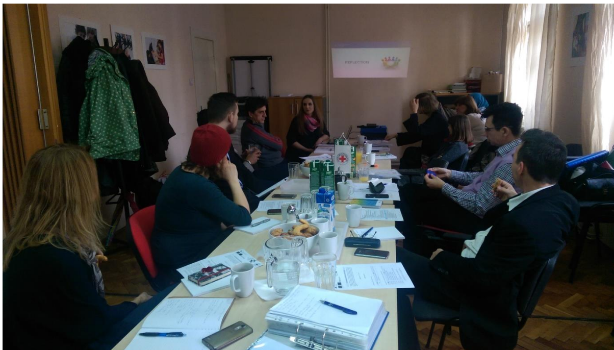
Fotografija 2: Strokovno usposabljanje na Hrvaškem

skladnih z Evropsko konvencijo o varstvu in človekovih pravicah. Poleg tega Rdeči križ Hrvaške tudi informira in svetuje migrantom za področja zdravstvenega in socialnega varstva, izobraževanja in kulture.